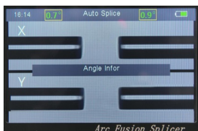
Immagine chiara della fibra e della giunzione

Batteria ad alta capacità da 6800mAh, fino a 330 cicli di giunzione e termo